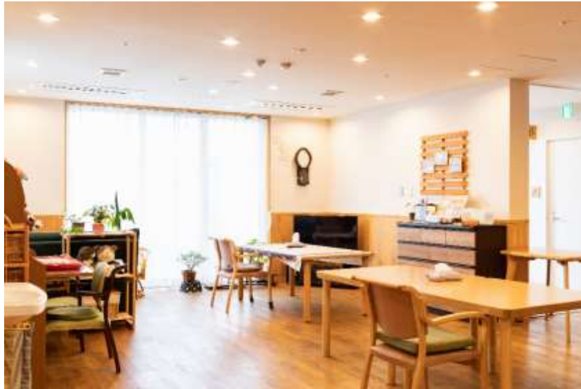
食堂・共同生活室

ご利用者が、食事や他のご利用者 と交流する場として、全ユ ニットに設けております。